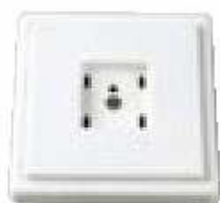
Správna telefónna zásuvka