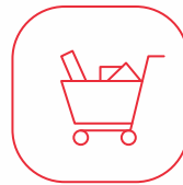
InStore Behavior & Product Zones Performance