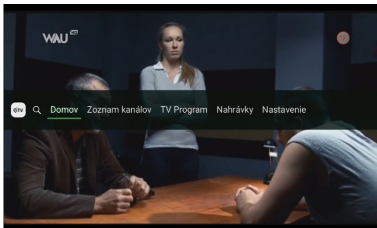
Obrázok 1 Navigácia do sekcie programového sprievodcu (EPG)